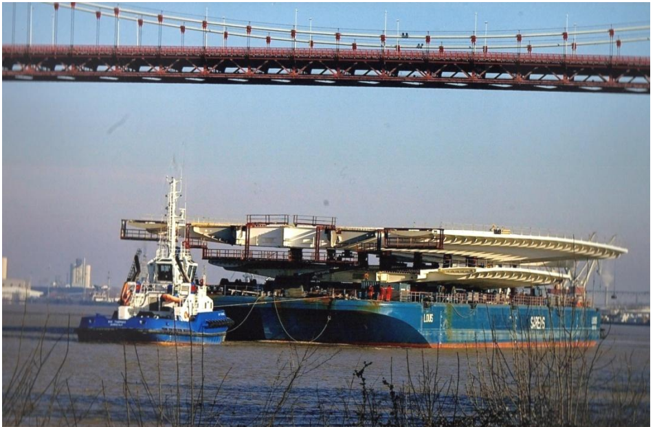
« Élément du pont Chaban Delmas » Jean-Claude COLOMBET – Génissac – 33